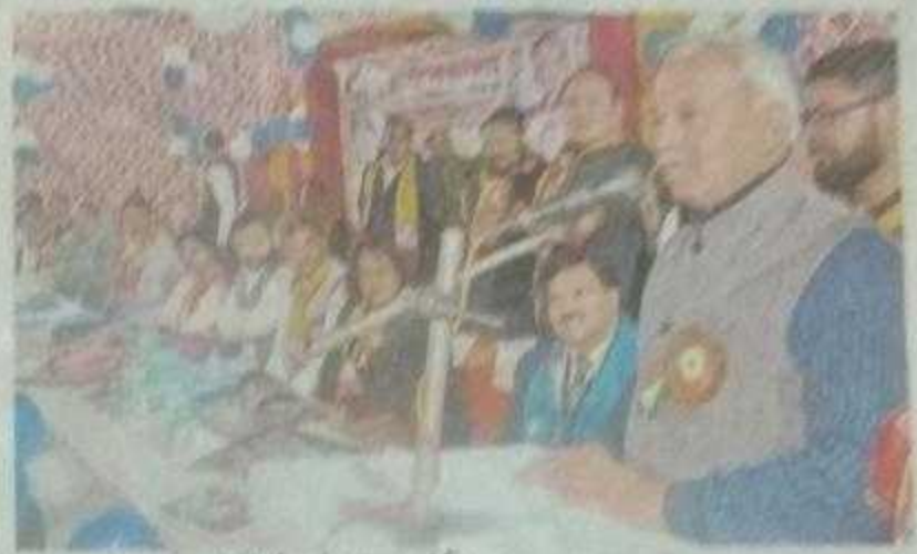
भरतपुर, सम्मेलन में बोलते राज्य मंत्री।