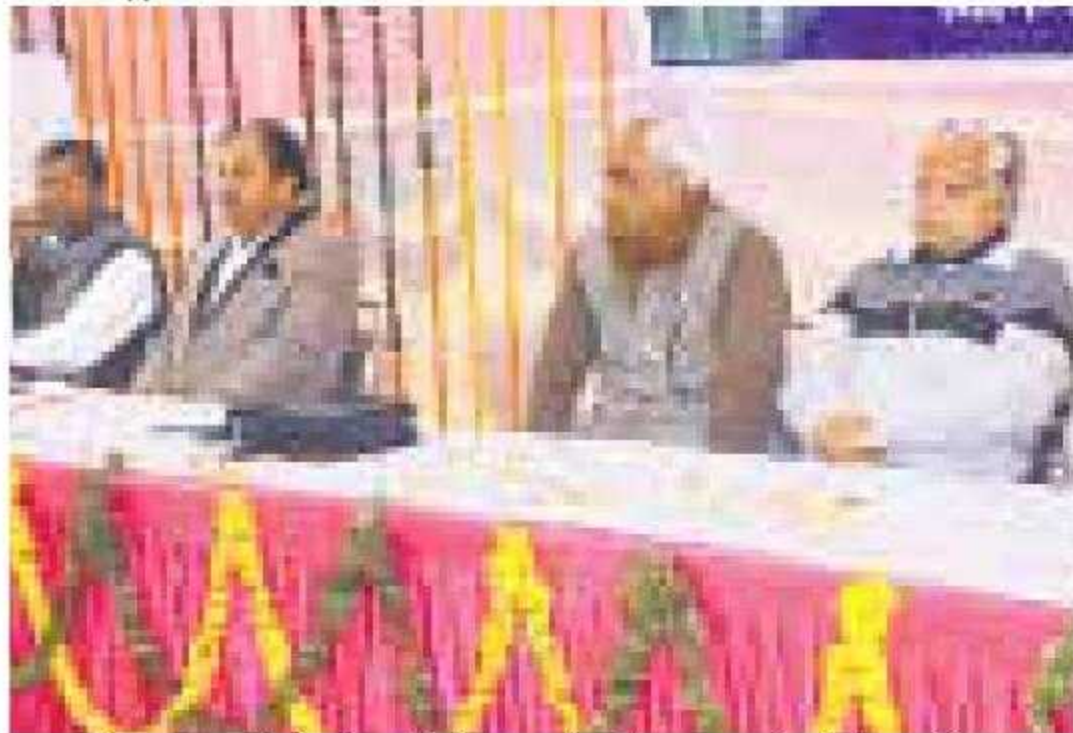
भरतपुर। शिक्षक संघ राष्ट्रीय के प्रदेश स्तरीय शिक्षक सम्मेलन के समापन समारोह में मौजूद अतिथि।

राजस्थान शिक्षक संघ राधाकृष्णन के प्रदेश स्तरीय सम्मेलन का आयोजन जयपुर में हुआ, जिसमें भरतपुर की ओर से