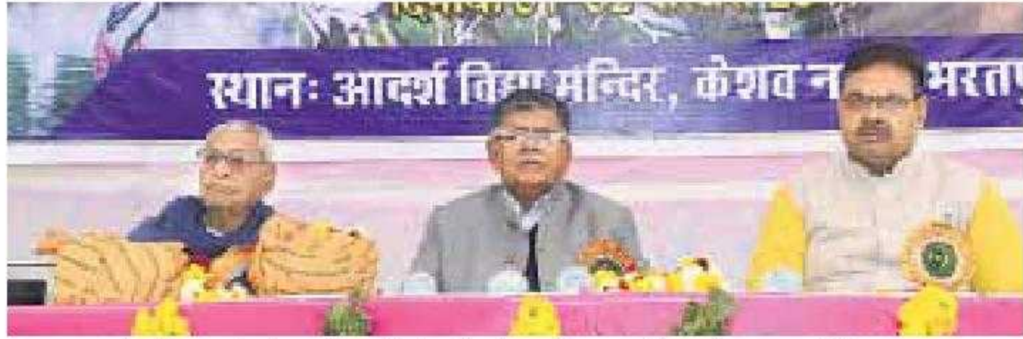
भरतपुर. राष्ट्रीय शिक्षक संघ के सम्मेलन में मंचासीन नेता प्रतिपक्ष कटारिया और अन्य अतिथि।