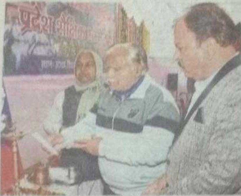
भरतपुर, कार्यक्रम का शुभारम्भ करते हुए।