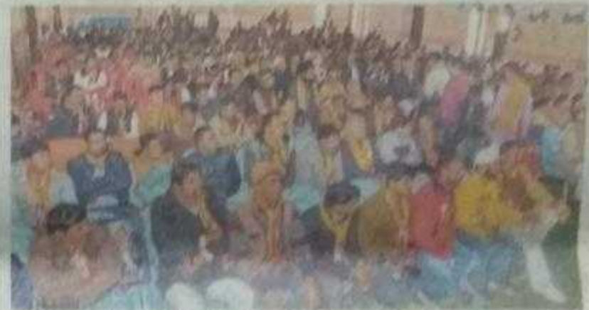
भरतपुर, सम्मेलन में बैठे लोग।