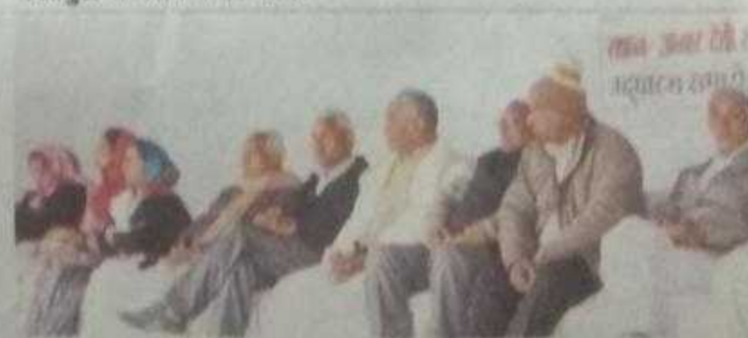
नगर, मंच पर बैठे अतिथि।